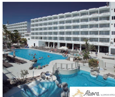
Playa del Inglés Abora Catarina by Lopesan Hotels 4*

A 1,5 km de la playa del Inglés y a 500 mts del centro comercial Kashbah. Restaurante buffet, bar salón con sala de televisión y zona de juegos y bar piscina. Wifi gratuito en todo el hotel. 2 piscinas (una de ellas infantil), climatizadas en invierno. Solárium con hamacas y sombrillas. Miniclub (4-12 años) y parque infantil. Tenis de mesa, jacuzzi y gimnasio gratuito. Animación. Entretenimiento infantil y deportes en compañía de otros niños.