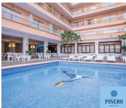
El Arenal Piñero Bahía de Palma 3*

En el centro de El Arenal, a unos 250 mts del Club Náutico, a 14km del centro de Palma y a 300 mts de la playa. Cuenta con un restaurante, bar, salón, de televisión, sala de juegos, rincón de internet (con cargo), zona de conexión Wifi (con cargo) en todo el hotel. Piscina exterior para adultos, otra piscina para niños y una zona solárium con tumbonas.