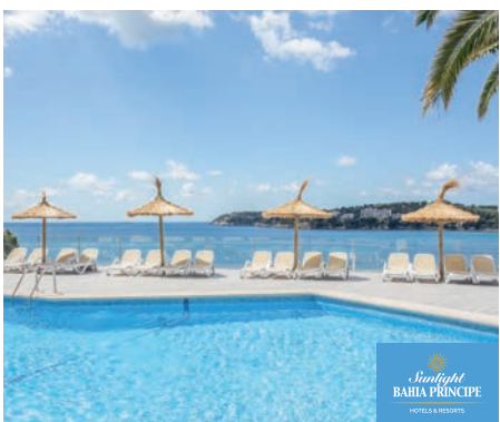
Magalluf Sunlight Bahía Principe Coral Playa 4*

En una zona de acantilados, entre las playas de Cala Domingos y Cala Antena. Restaurante buffet y snack bar. Wifi gratuita en zonas comunes y rincón de internet (con cargo). 2 piscinas, una infantil y otra para adultos, terraza-solárium con tumbonas y sombrillas, servicio de toalla para piscina (con depósito). Baby club, miniclub, y actividades para teenagers (según temporada).