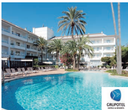
Playa de Muro Grupotel Alcudia Suite 4*

Sobre una colina desde donde se divisa una fabulosa panorámica de la playa de Son Maties, a la que se puede acceder directamente con ascensor exterior. Bar salón, salón de actividades, salón de televisión, sala de conferencias, rincón de internet (con cargo) y Wifi en todo el hotel (gratuito en recepción). En la parte exterior se encuentra un solárium con tumbonas y sombrillas con una piscina para adultos y otra para niños.