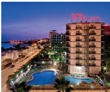
Playa del Inglés Beverly Park 3*

Al precio final con las fechas y alojamiento elegido, no le serán aplicados otros descuentos ni promociones