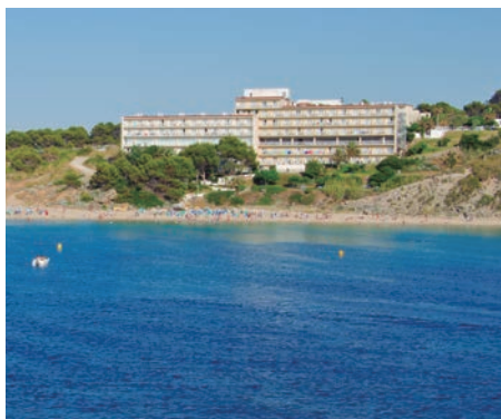
Arenal D'en Castell Club Hotel Aguamarina 4*

Al precio final con las fechas y alojamiento elegido, no le serán aplicados otros descuentos ni promociones