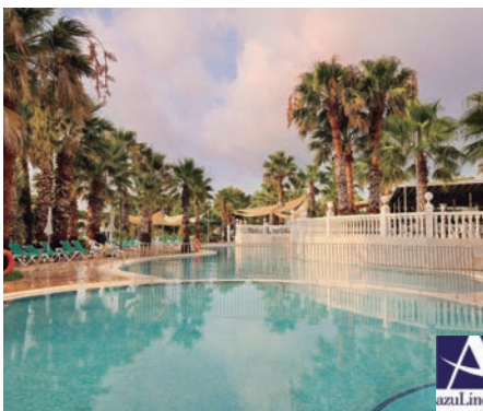
Arenal D'en Castell Azuline Marina Parc 4*

En 1ª línea de mar y a escasos metros de una playa, con acceso directo. 2 restaurantes, 2 bares, sala de televisión, Internet corner de uso libre con acceso a internet (con cargo), Wifi (con cargo). 5 piscinas: 2 piscinas de 25 mts, una de burbujas sólo para adultos y 2 piscinas infantiles, solárium con tumbonas y servicio de toallas (en alquiler). Gimnasio. Animación.