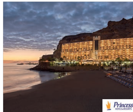
Taurito Taurito Princess 4*

En 1ª línea de mar, cerca de la playa y de las Dunas de Maspalomas. 2 restaurantes buffet, 3 restaurantes a la carta y 6 bares. Wifi gratis en bar central y wifi en zonas comunes (con cargo) 4 piscinas para adultos, piscina infantil, 2 solárium (en zona VIP), hamacas sombrillas y toallas de piscina (con cargo). Parque infantil, miniclub y minidisco. Centro Spa (con cargo). Animación con actividades de wellness y de deporte con shows nocturnos.