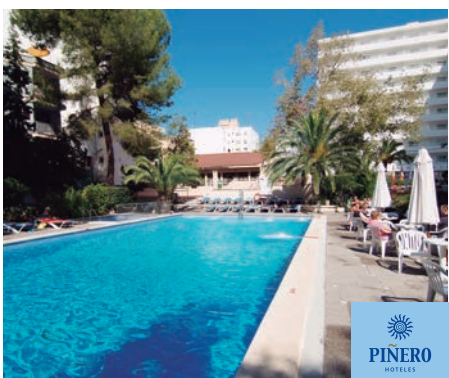
El Arenal Piñero Tal 3*

Al precio final con las fechas y alojamiento elegido, no le serán aplicados otros descuentos ni promociones