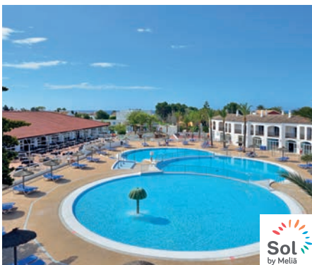
Cala'n Bosc Sol Falco All Inclusive 4*

Sobre la pintoresca Cala'n Forcat de aguas cristalinas. A 200 metros de una pequeña zona comercial. Restaurante principal, bar salón, bar terraza, bar piscina. 2 salas de conferencias, rincón de internet (con cargo) y Wifi. Servicio Wifi Premium disponible (con cargo). Piscina para adultos de agua de mar y rodeada de terraza, piscina infantil de agua de mar y servicio de toallas de piscina. Parque infantil, "Hobby Club" de 5 a 12 años, juegos de mesa y minidisco.