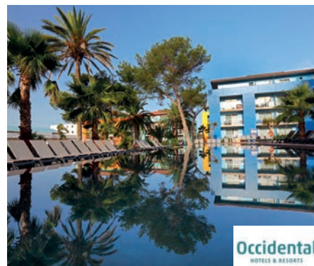
Punta Prima Occidental Menorca 4*

A tan solo 250 metros de la magnífica playa de Son Xoriguer. Restaurante Buffet, bar salón, restaurante snack Tex-Mex, área Wifi en todo el hotel gratuito y rincón de internet (con cargo). Amplios jardines y terrazas, 7 piscinas exteriores (3 centrales, 1 semi-olímpica para actividades deportivas y 3 más repartidas en los jardines del hotel), piscina infantil, tumbonas y servicio de toallas de piscina (depósito y cargo). Dos clubs infantiles divididos por grupos de edades.