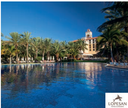
Costa Melonera Lopesan Costa Meloneras Resort 4* Sup

A 3,5 km de la playa de Maspalomas. Autobús gratuito a la playa varias veces al día. Restaurante, 2 bares, discoteca, Wifi gratuito. 2 piscinas (1 de ellas climatizada en invierno), solárium, tumbonas, sombrillas y servicio de toallas (con depósito). Parque infantil acuático, miniclub (4-12 años), minidisco y servicio de niñera (bajo petición y con cargo) y piscina infantil con juegos acuáticos. Ping pong y billar (con cargo). Animación. Centro de estética y masajes (con cargo).