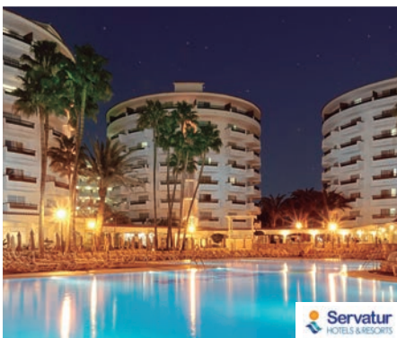
Playa del Inglés Hotel Servatur Waikiki 4*

Frente al mar, a 100 metros de la playa. A 500 metros de un centro comercial. Restaurante buffet, 2 bares, salón social, sala de juegos de mesa y Wifi en todo el establecimiento (con cargo). Zonas ajardinadas, 3 piscinas para adultos (una climatizada en invierno), 2 piscinas infantiles, terraza-solárium con 2 jacuzzis, hamacas y sombrillas. Parque infantil y miniclub. Sauna y masajes (ambos con cargo). Programa de animación.