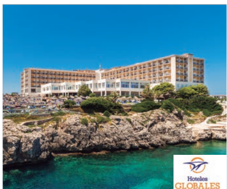
Cala'n Forcat Globales Club Almirante Farragut 4*

A 300 metros de Cales Piques y a 4 kilómetros de Ciutadella. A tan sólo 4 kilómetros de la antigua capital de Menorca, Ciutadella. 2 restaurantes, 2 bares y zona Wifi. 5 piscinas, dos de ellas infantiles y zona de juegos acuáticos. Solárium con hamacas y sombrillas. Billar (con cargo) y alquiler de bicicletas (con cargo). Actividades y animación.