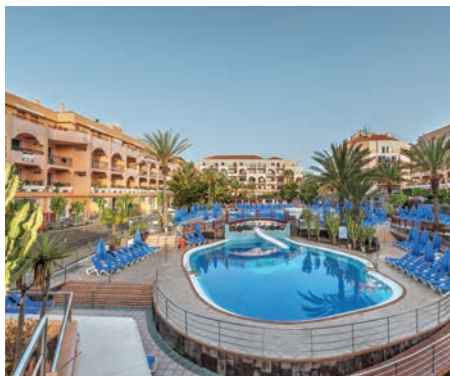
Sonneland Mirador Maspalomas by Dunas 4*

En una céntrica zona de Playa del Inglés, muy próxima a las Dunas de Maspalomas. Servicio de autobús gratuito del hotel a la playa varias veces al día. Restaurante tipo buffet, snack bar, bar Lobby, pool bar. Wifi incluido. Jardín de vegetación subtropical zona "sólo adultos", 5 piscinas (2 para niños y 1 climatizable). Servicio de guardería (con cargo), parque infantil y Aboritos Club. Actividades deportivas y programa nocturno con shows.