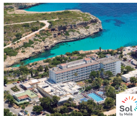
Calas de Mallorca Sol Cala Antena 3*

En el centro de El Arenal, a unos 250 mts del Club Náutico, a 14 km del centro de Palma y a unos 250 mts de la playa. Cuenta con un restaurante, bar, salón, salón social, rincón de internet (con cargo), zona de conexión Wifi (con cargo) en las zonas comunes, salón de reuniones y gran salón para actividades del programa de animación. Piscina exterior para adultos, otra para niños.