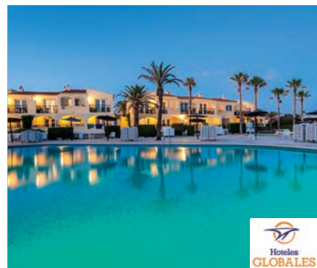
Cala'n Forcat Globales Binimar 4*

A aproximadamente 500 metros de una playa. Restaurante buffet y 7 bares. Salón de TV, teatro y Wifi en áreas comunes. 3 piscinas, terraza-solárium con hamacas y sombrillas, toallas de piscina (con cargo). Parque acuático, miniclub y parque infantil. Pista de tenis, tiro con arco y billar (con cargo). Gimnasio y Centro Spa (con cargo). Animación y actividades.